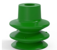
Referencia de la variante: 80A 27SLV A