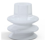
Referencia de la variante: 80A 27SLT A