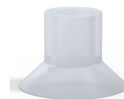
Referencia de la variante: 72 40SLT A