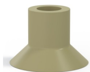
Referencia de la variante: 72 40CN A