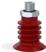
Variantenreferenz: 95 40SL O