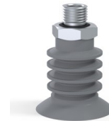
Variantenreferenz: 95 40NR O