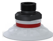
Variantenreferenz: 90 50SLT 38D-2-GIC