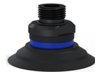
Variantenreferenz: 90 50NI 38D-2-GIC