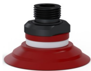
Variantenreferenz: 90 50SL 38D-2-GIC