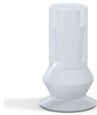
Variantenreferenz: 8 08SLT A