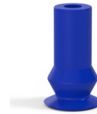
Variantenreferenz: 8 08PU A