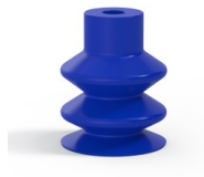
Variantenreferenz: 2 18PU A