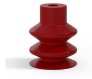
Variantenreferenz: 2 18SL A