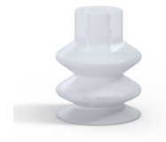
Variantenreferenz: 2 18SLT A