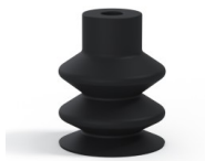
Variantenreferenz: 2 18NI A