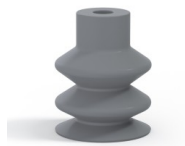
Variantenreferenz: 2 18NR A