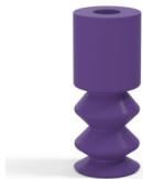
Variantenreferenz: 2 11MNT A