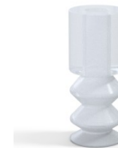
Variantenreferenz: 2 11SLT A