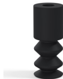
Variantenreferenz: 2 11NI A