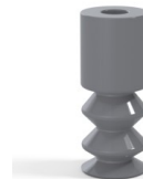
Variantenreferenz: 2 11NR A