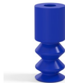
Variantenreferenz: 2 11PU A