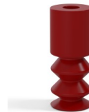
Variantenreferenz: 2 11SL A