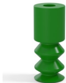
Variantenreferenz: 2 11SLV A