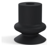
Variantenreferenz: 1 14NI A