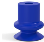
Variantenreferenz: 1 14PU A