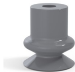
Variantenreferenz: 1 14NR A