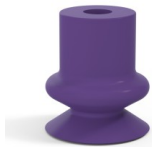
Variantenreferenz: 1 14MNT A