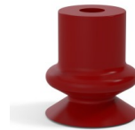
Variantenreferenz: 1 14SL A