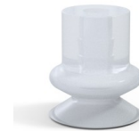
Variantenreferenz: 1 14SLT A