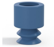
Variantenreferenz: 81 13SLBLEU A